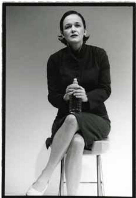
bash - Stücke der letzten Tage