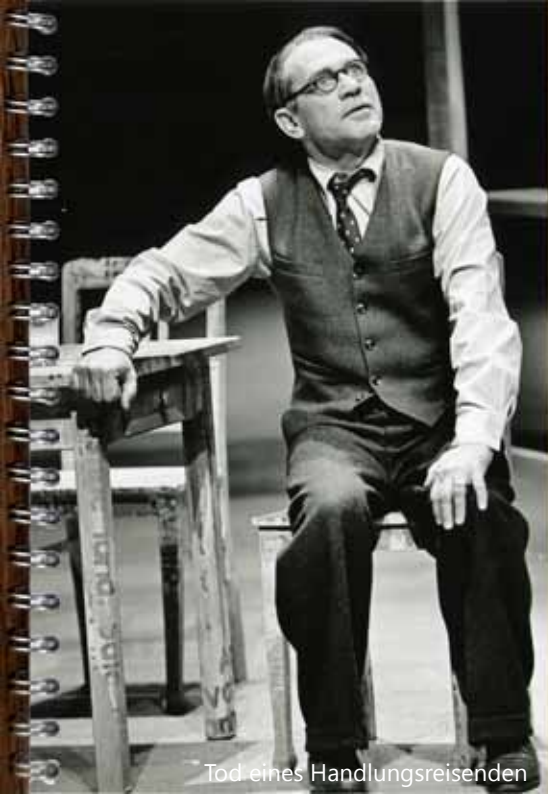
Tod eines Handlungsreisenden