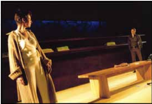
Auf dem Land